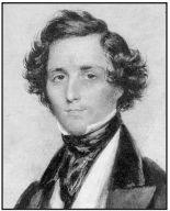
Felix Mendelssohn Bartholdy (1809 bis 1847)

„Der Lindenbaum“ (aus dem Liederzyklus „Die Winterreise“) Sinfonie Nr. 7 („Die Unvollendete“)