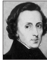
Frédéric Chopin (1810 bis 1849)