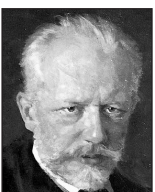
Peter Iljitsch Tschaikowsky (1840 bis 1893)