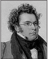
Franz Schubert (1797 bis 1828)

„Der Lindenbaum“ (aus dem Liederzyklus „Die Winterreise“) Sinfonie Nr. 7 („Die Unvollendete“)