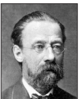
Bedřich Smetana (1824 bis 1884)

„Gefangenenchor“ (aus der Oper „Nabucco“)