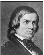
Robert Schumann (1810 bis 1856)

„Träumerei“ (aus dem Zyklus „Kinderszenen“)