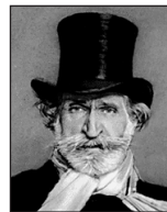
Giuseppe Verdi (1813 bis 1901)

„Träumerei“ (aus dem Zyklus „Kinderszenen“)