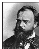
Antonin Dvorák (1841 bis 1904)