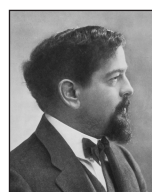
Claude Debussy (1862 bis 1918)

„In der Halle des Bergkönigs“ (aus der „Peer Gynt-Suite“)